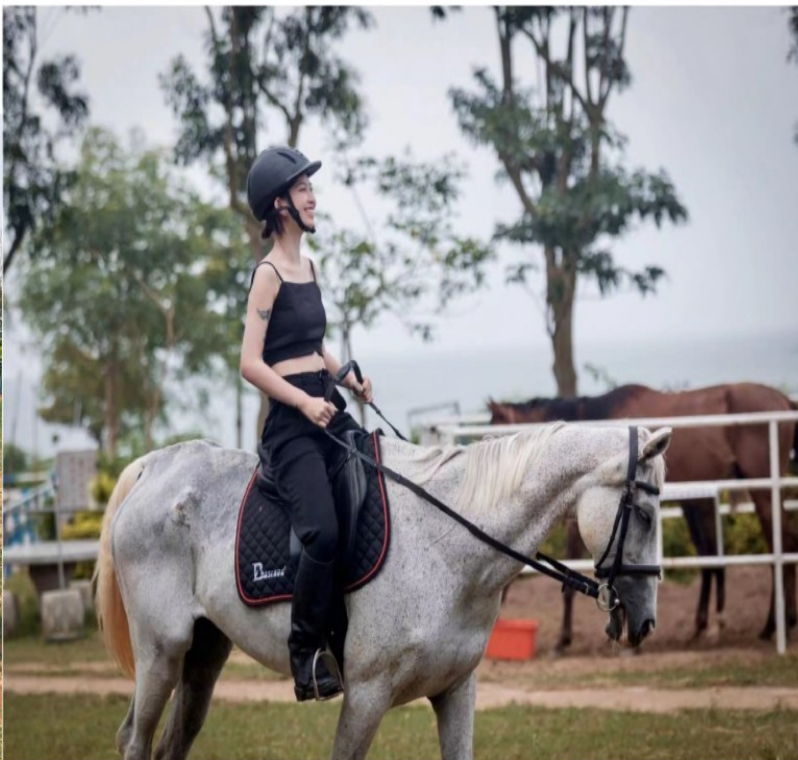
【微風海戀騎馬拍照體驗】微風海戀民宿配合金門喬安牧場馬術協會，是金門唯一一家海邊馬場民宿，馬匹多為歐洲與美國品種溫血馬、可以在馬背上遙望金門大橋、廈門等美景